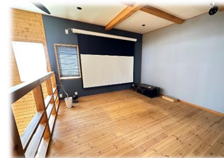
家族団らん♪シアタールーム