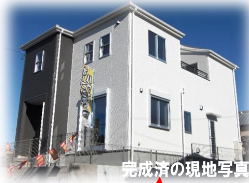
完成済の現地写真