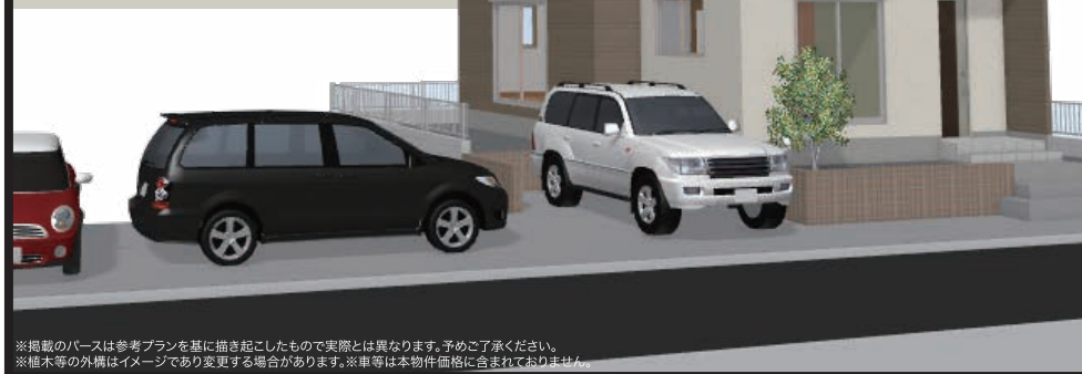
※掲載のイメージは参考プランを基に描き起こしたもので実際とは異なります。予めご了承ください。※植木等の外構はイメージであり変更する場合があります。※車等は本物件価格に含まれておりません。