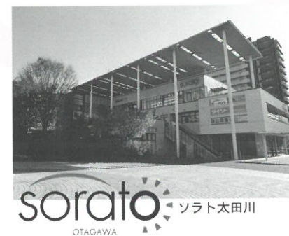
sorato ソラト太田川 OTAGAWA