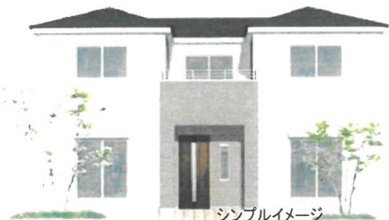
シンプルイメージ