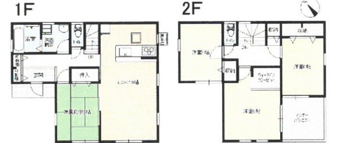
モダンスタイルプラン