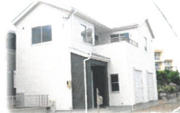
完成建物ご案内いたします。