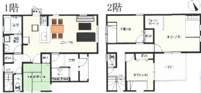
フレンチスタイルプラン