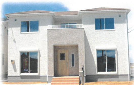
フレンチスタイル施工例イメージ