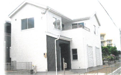
モダンスタイル施工例イメージ