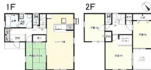
モダンスタイルプラン