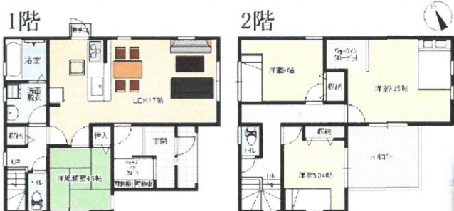
フレンチスタイルプラン