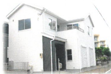
完成建物ご案内いたします。モダンスタイルイメージ施工例