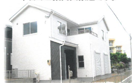
モダンスタイル施工例イメージ