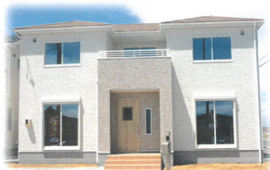
フレンチスタイル施工例イメージ