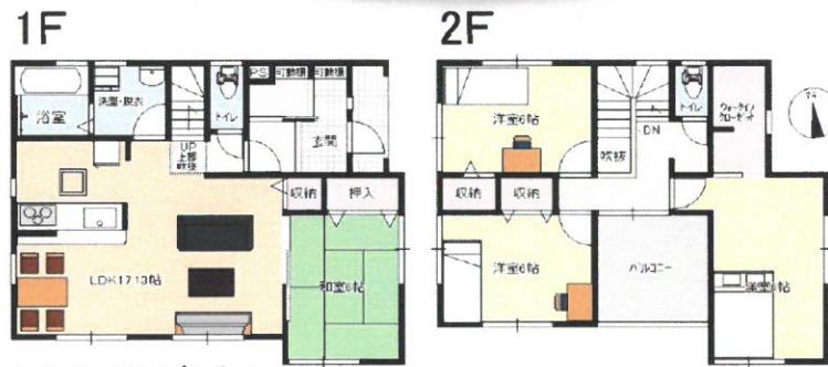
フレンチスタイル