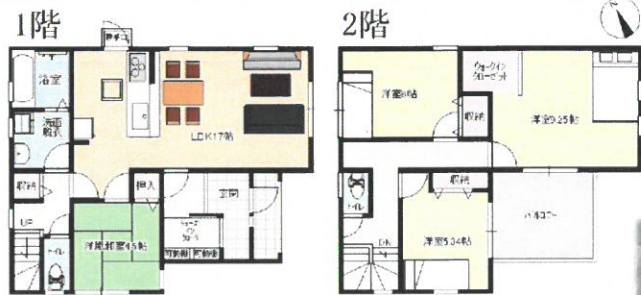
フレンチスタイルプラン