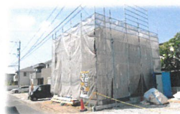
完成建物ご案内いたします。