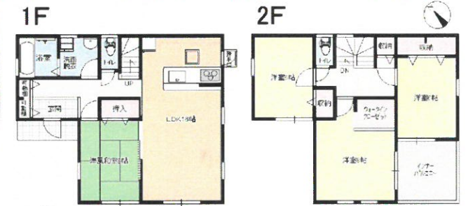
モダンスタイルプラン